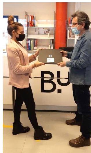
Prêt d'ordinateur portable (Bibliothèque de campus de Montbéliard)