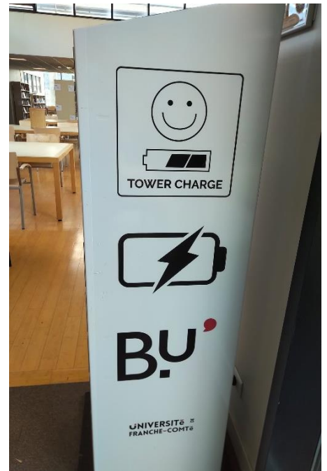
Tour de rechargement pour tablettes et téléphones portables (BU Santé)