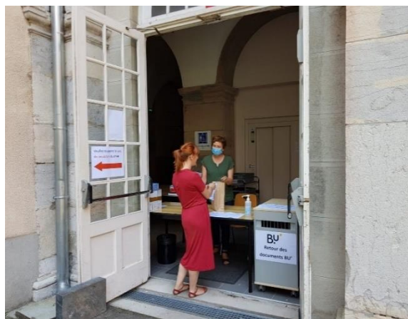
« Documents à emporter » (BU Lettres et sciences humaines)

...tout pour garantir la continuité des services aux publics malgré la crise sanitaire et les confinements : développement des ressources et des services en ligne, prêt d'ordinateurs aux étudiants en situation de précarité, nouveaux services, « documents à emporter » et réservation de places assises en BU sur Affluences.