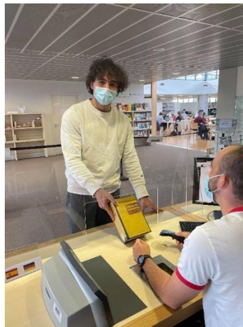
1 er prêt avec le nouveau système d'information des BU (BU Santé)