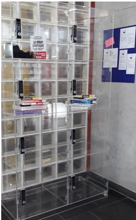
Casiers de consigne (BU Proudhon)

De nombreux projets sont en cours pour répondre au mieux à vos demandes : rendez-vous sur les pages Facebook, Twitter , Instagram des B.U' et sur https://scd.univ-fcomte.fr pour suivre notre actualité.